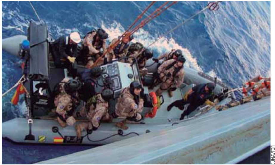
Un grupo de asalto de las fuerzas españolas aborda el Royal Grace tras ser abandonado por los piratas.

—Las oportunidades de encuentro directo en la mar son escasas en la inmensidad del área de operaciones, pero confío en que durante mi mandato se hayan sentido algo más seguros. Aunque no hay distinción de banderas en el cumplimiento de nuestra misión, siempre hemos puesto especial atención en ellos, por otra parte magníficamente respaldados por el Centro de Operaciones de Vigilancia y Acción Marítima (COVAM) de la Armada, con el que mantenemos contacto diario. También han sido de inestimable ayuda, pues gracias a la información facilitada por dos barcos pudimos localizar y detener a un grupo compuesto por dos esquifes con ocho presuntos piratas a bordo.