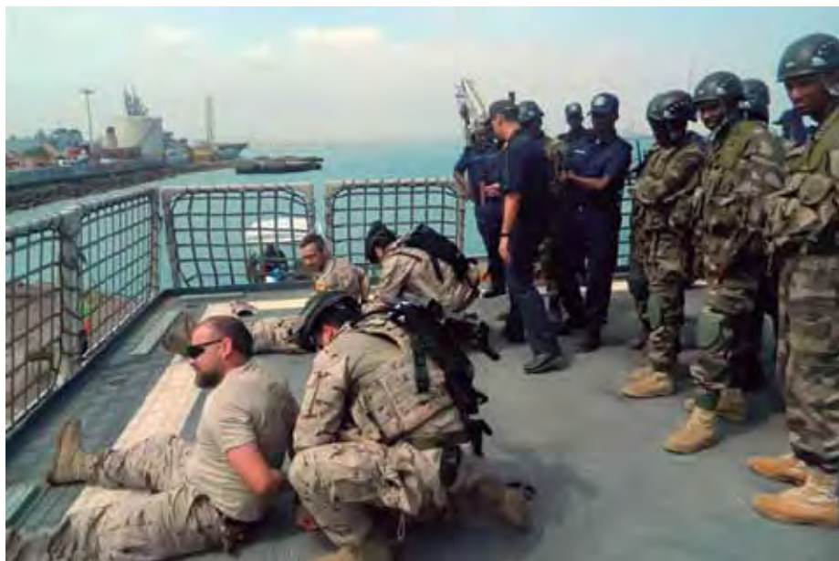
Una delegación de 32 miembros de la marina y la guardia costera de Yibuti fue adiestrada a bordo del BAM Rayo en técnicas de abordaje.