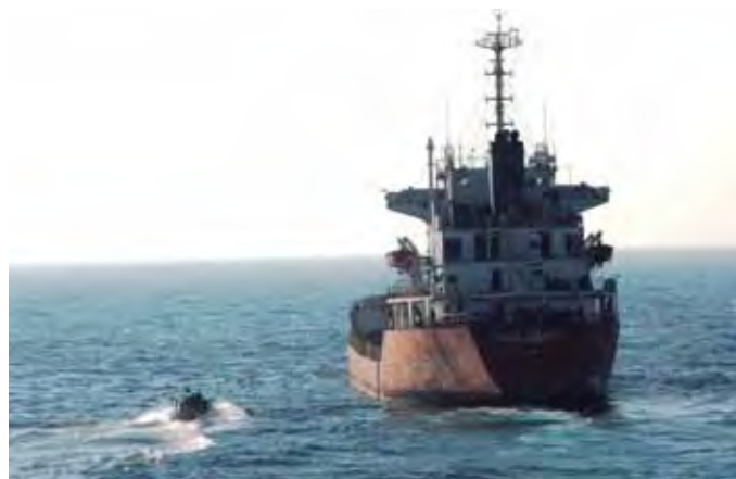
El Royal Grace , liberado el pasado 8 de marzo, ha permanecido más de un año en manos de los piratas.

con un total de 17 piratas, impidiendo que se consumara el secuestro del buque norcoreano Dae San ; el esclarecimiento del secuestro del dhow Al Hasan y su utilización como buque nodriza de un grupo de siete piratas que alcanzó el Golfo de Omán efectuando dos ataques fallidos antes de ser desactivado; la contribución a la vigilancia y obtención de inteligencia sobre las actividades en los campamentos piratas; la intervención en dos asistencias de seguridad de la vida humana en la mar; y el adiestramiento de unidades de la guardia costera y de la marina de los países visitados. Esta última labor se