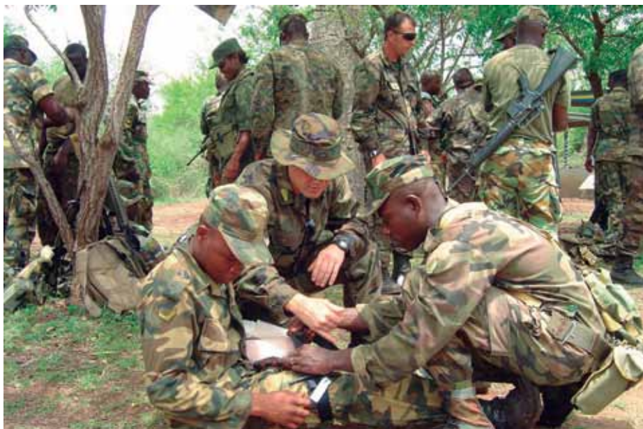
En Africa Partnership Station la Infantería de Marina lideró las operaciones en tierra.

Asimismo, España está presente desde 2006 en los ejercicios de operaciones especiales Flintlock , dirigidos por el Mando estadounidense en África (AFRICOM) y concebidos para apoyar y mejorar las capacidades militares de los países del Sahel, fomentando la colaboración regional en contraterrorismo.