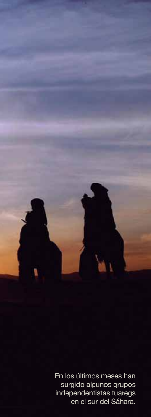
En los últimos meses han surgido algunos grupos independentistas tuaregs en el sur del Sáhara.