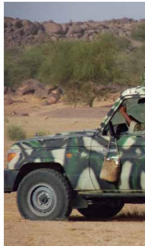
Arriba, un vehículo de los tropas rebeldes de los tuareg patrulla en la zona norte de Mali. Abajo, el capitán golpista Amadu Sanogo (segundo por la derecha) en un campamento cercano a la ciudad de Bamako.