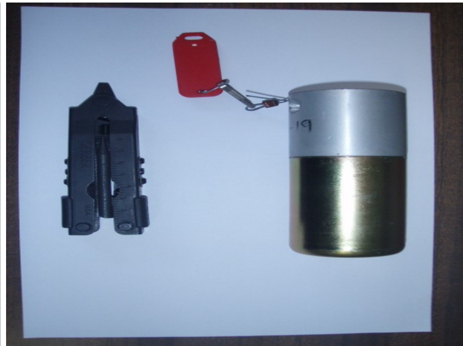
CONTENEDOR: BOMBA BME 330B/AP SUBMUNICIÓN: NEGADORA DE AREA