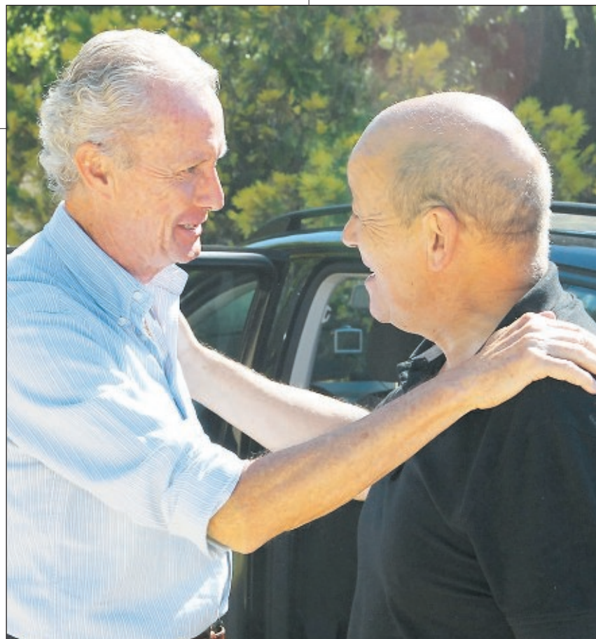
Pedro Morenés se despide de su homólogo francés, Jean Yves Le Drian, con un abrazo tras su pasado encuentro en Gredos

pública y para el mundo civilizado en general, pero el Consejo de Seguridad no aprueba una intervención basada en el veto de Rusia y en menos insistencia de China. En cuanto a Egipto, yo creo que es todavía mucho más impensable, está en estos momentos estableciéndose una posición común europea sobre Egipto y que insta a las partes a que se resuelvan los asuntos desde el punto de vista de las instituciones democráticas, restituyendo los poderes legítimamente constituidos y que se terminen las matanzas que no son aceptables desde ningún punto de vista.