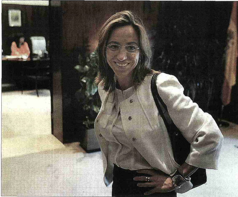
La ministra de Defensa, junto a su despacho en la sede de su departamento.

R. En el desarrollo que ha tenido el tratamiento de las misiones de paz desde que Zapatero es presidente, primero fijamos un límite global de 3.000 efectivos en el exterior por decisión del Consejo de Ministros y luego aprobamos una ley de Defensa Nacional, para que ningún soldado español salga de nuestras fronteras sin el aval de la legalidad internacional y respaldo del Parlamento. Eso me lleva a la reflexión de que quizá ha quedado obsoleto el acuerdo del Consejo de Ministros por cuanto la propia ley hace que se autorice un número máximo de efectivos para cada misión. Anuncié mi intención de compartir esa reflexión con las fuerzas políticas.